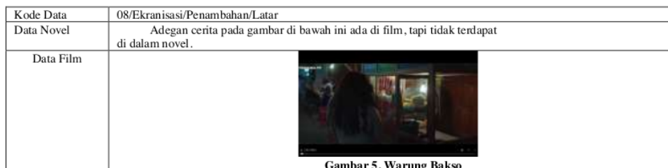
Gambar 5. Warung Bakso