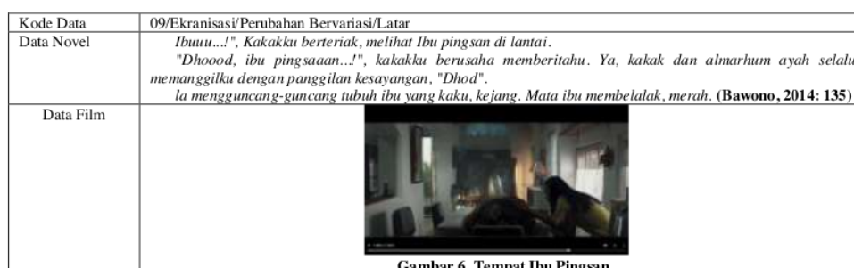
Gambar 6. Tempat Ibu Pingsan