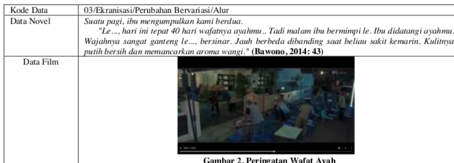
Gambar 2. Peringatan Wafat Ayah